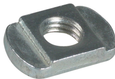
651 9 OXX