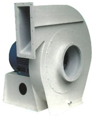
RL EX str. 606

Wentylatory dobierane wg żądanego przez Klienta punktu pracy.