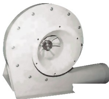
PB EX str. 607