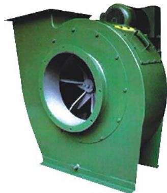
PH EX str. 607