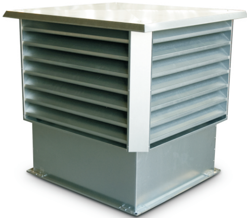
Wyrzutnia dachowa WPD typu B ▲ do prostokątnych szachtów wentylacyjnych.