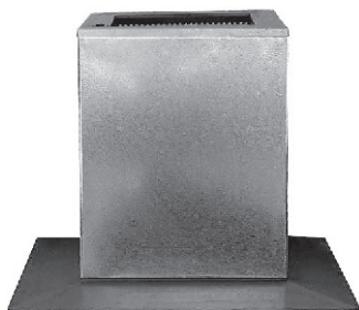
Podstawa dachowa PDT ▲ do prostokątnych szachtów wentylacyjnych.

PDT i PDTK pełnią rolę tłumika akustycznego, ograniczającego hałas wentylatora oraz umożliwiają przeprowadzenie instalacji wentylacyjnej przez płaszczyznę dachu. Stanowią element przenoszący na konstrukcję dachu ciężar urządzeń wentylacyjnych zamontowanych na podstawie dachowej.