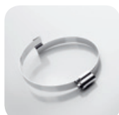
Obijma Clip Grip