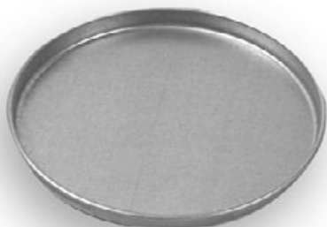
Wersja z uszczelką ESL