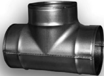
Wersja z uszczelką TSHFL